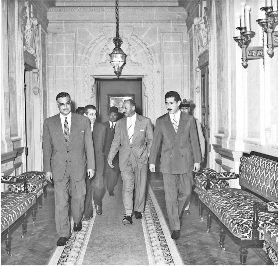
اجتماع عبد الناصر بالوزارة في قصر القبة ١١/١٠/١٩٥٨

الوزراء الذين يجمعون بين منصب الوزير المركزي والوزير التنفيذي، يحضرون اجتماعات المجلس التنفيذي في الاقليم.